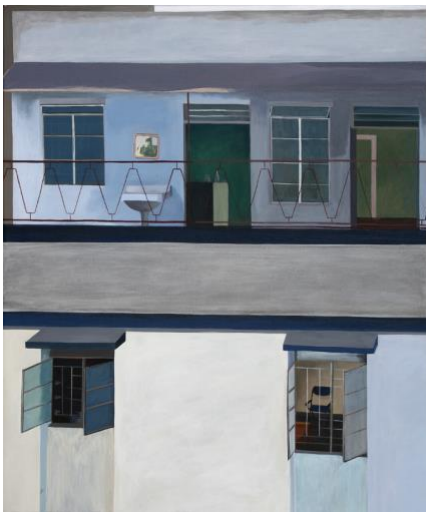
Neighbourhood 2 (2007)