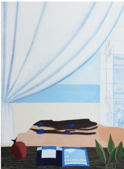
Necessary things (2015)

Een intrigerend schilderij is Factory shed (2008), waarop een weg tussen twee fabrieksterreinen is weergegeven. Een van die terreinen is ook zichtbaar: achter een groot hek staan verschillende vormen die als gebouwen opgevat kunnen worden, en een grote, prominente fabriekshal. Ik zeg bewust 'opgevat': de grijze vormen of vlakken achter het hek roepen associaties op met gebouwen, en die invulling zou binnen de context van het schilderij logisch zijn, maar de ene vorm blijft beperkt tot een grijs vlak, en het andere bestaat uit twee vlakken die samen op een huis zonder dak lijken. Daarnaast is een gebogen lijn te vinden die aan een dak doet denken. De fabriekshal eist de aandacht op. Die lijkt een tempel, een associatie die versterkt wordt door het mysterieuze, groen licht dat erin schijnt. Maar dat groen heeft ook een ongezonde, chemische kleur. We zien mensen naar het terrein kijken, maar kijken ze wel naar de hal? Wat is hier aan de hand?